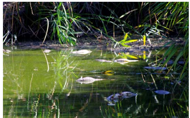
Agosto de 2013. Árboles secándose por falta de humedad. Baja el nivel del agua y aparecen los primeros peces muertos.